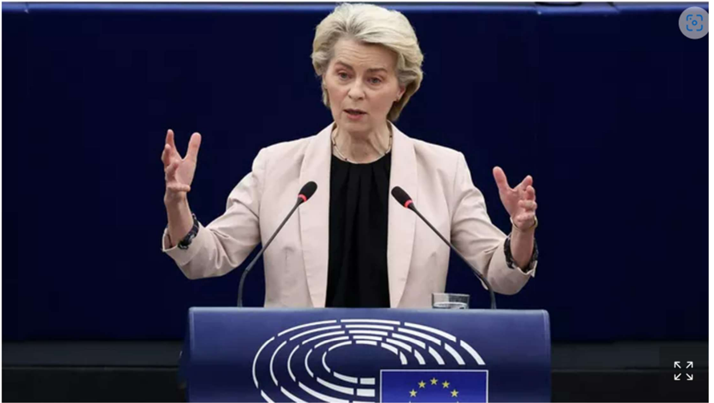
La présidente de la Commission européenne Ursula von der Leyen devant le Parlement de Strasbourg, le 27 novembre.

DÉCRYPTAGE - La présidente de la Commission européenne est arrivée en Uruguay dans l'espoir de conclure, malgré l'hostilité d'Emmanuel Macron.