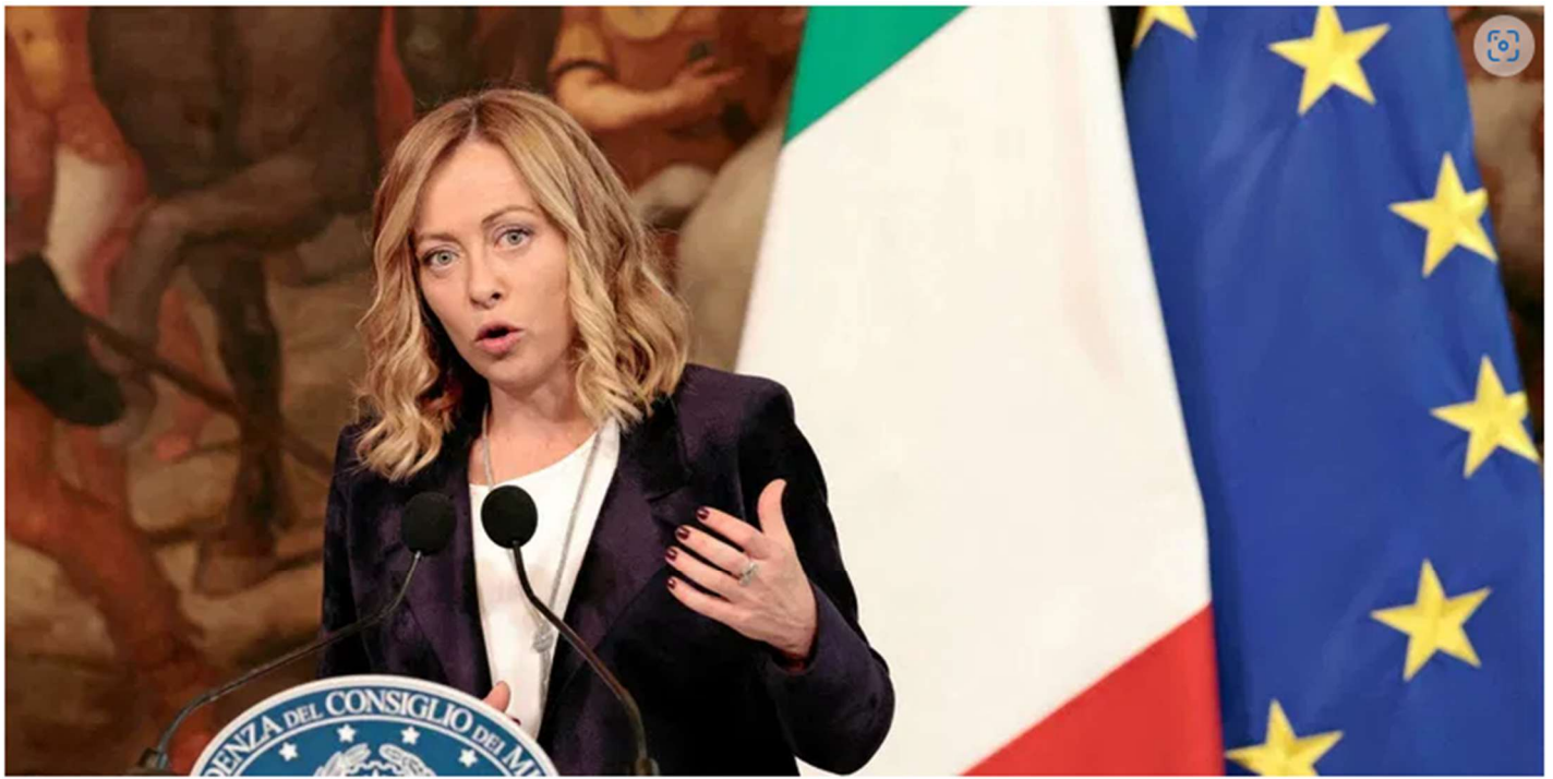
Giorgia Meloni, présidente du Conseil italien, à Rome (Italie), le 5 novembre 2024.