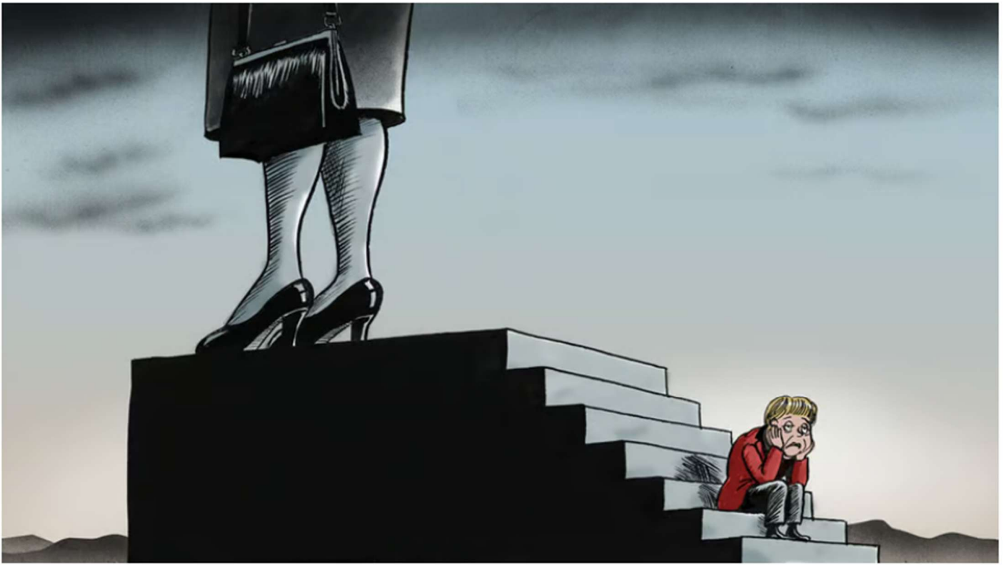
ILLUSTRATION: PETER SCHRANK