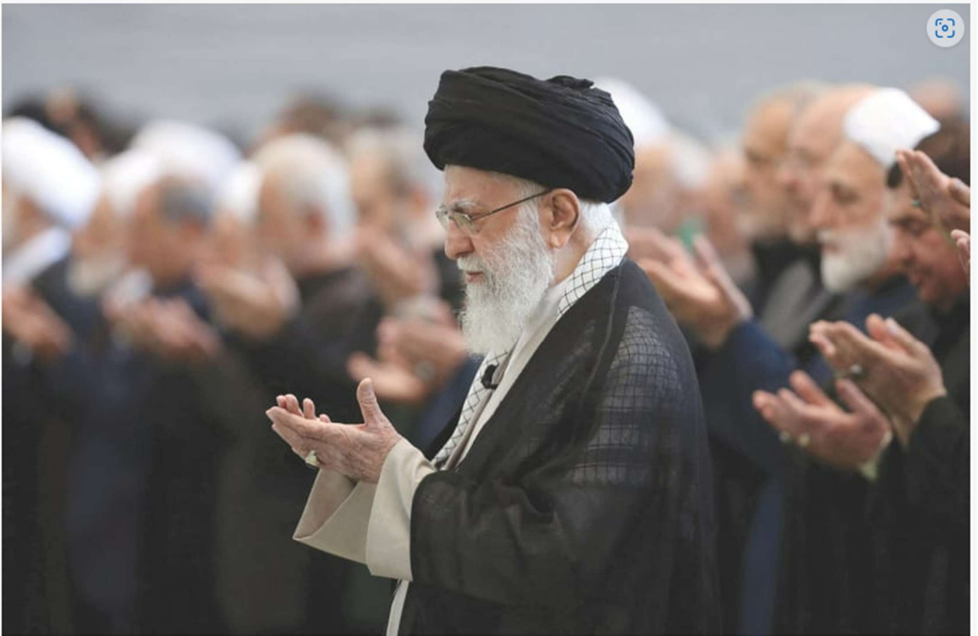
IRAN'S SUPREME Leader Ayatollah Ali Khamenei attends Friday prayers and a memorial ceremony for Hassan Nasrallah in Tehran earlier this month.