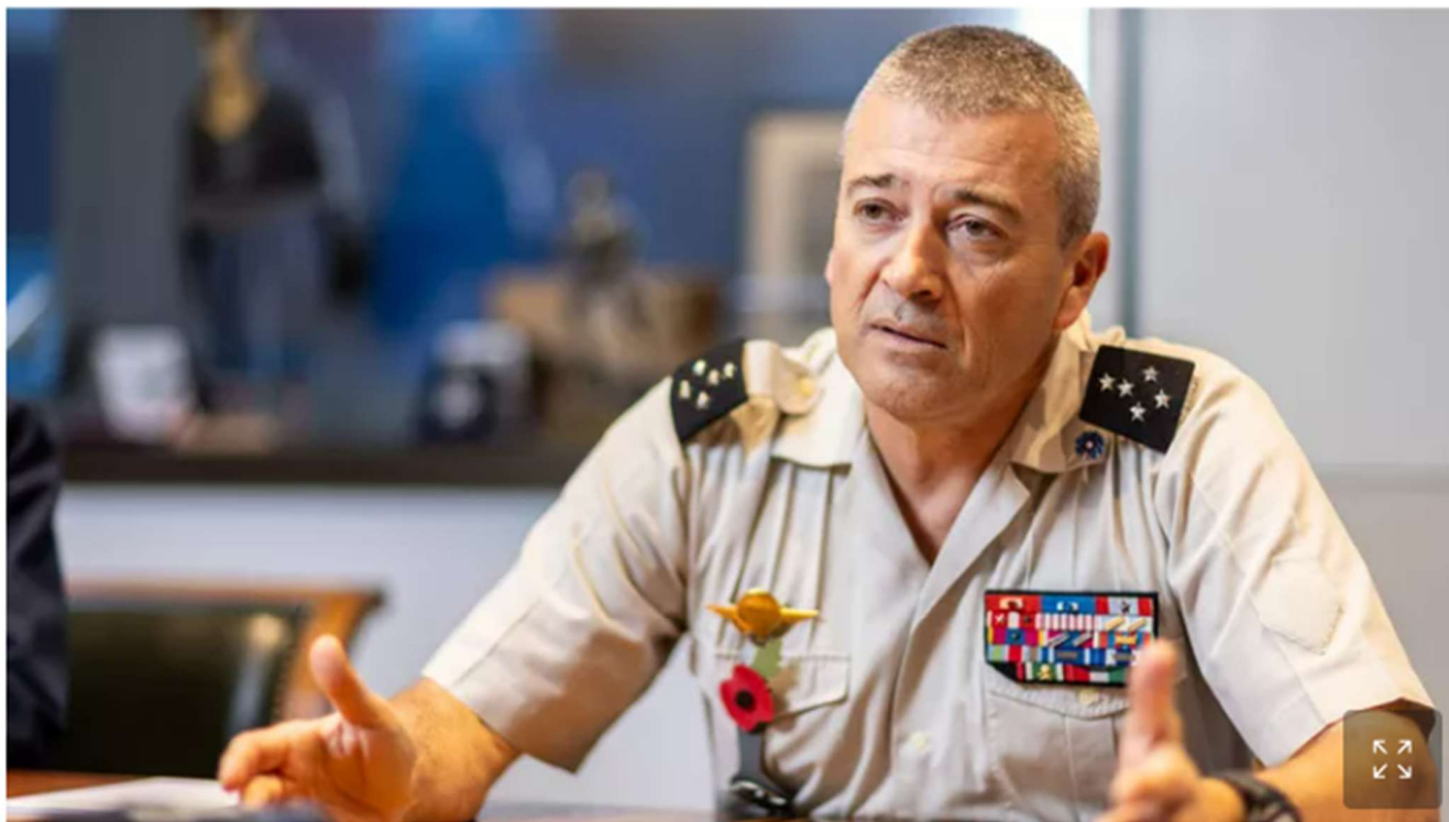
Le général d'armée Thierry Burkhard, chef d'état-major des armées, dans son bureau à Balard.

ENTRETIEN EXCLUSIF - À l'occasion des commémorations du 11 novembre, le chef d'état-major des Armées passe en revue les grands enjeux et défis de la défense française et européenne, après l'élection de Donald Trump pour un second mandat.