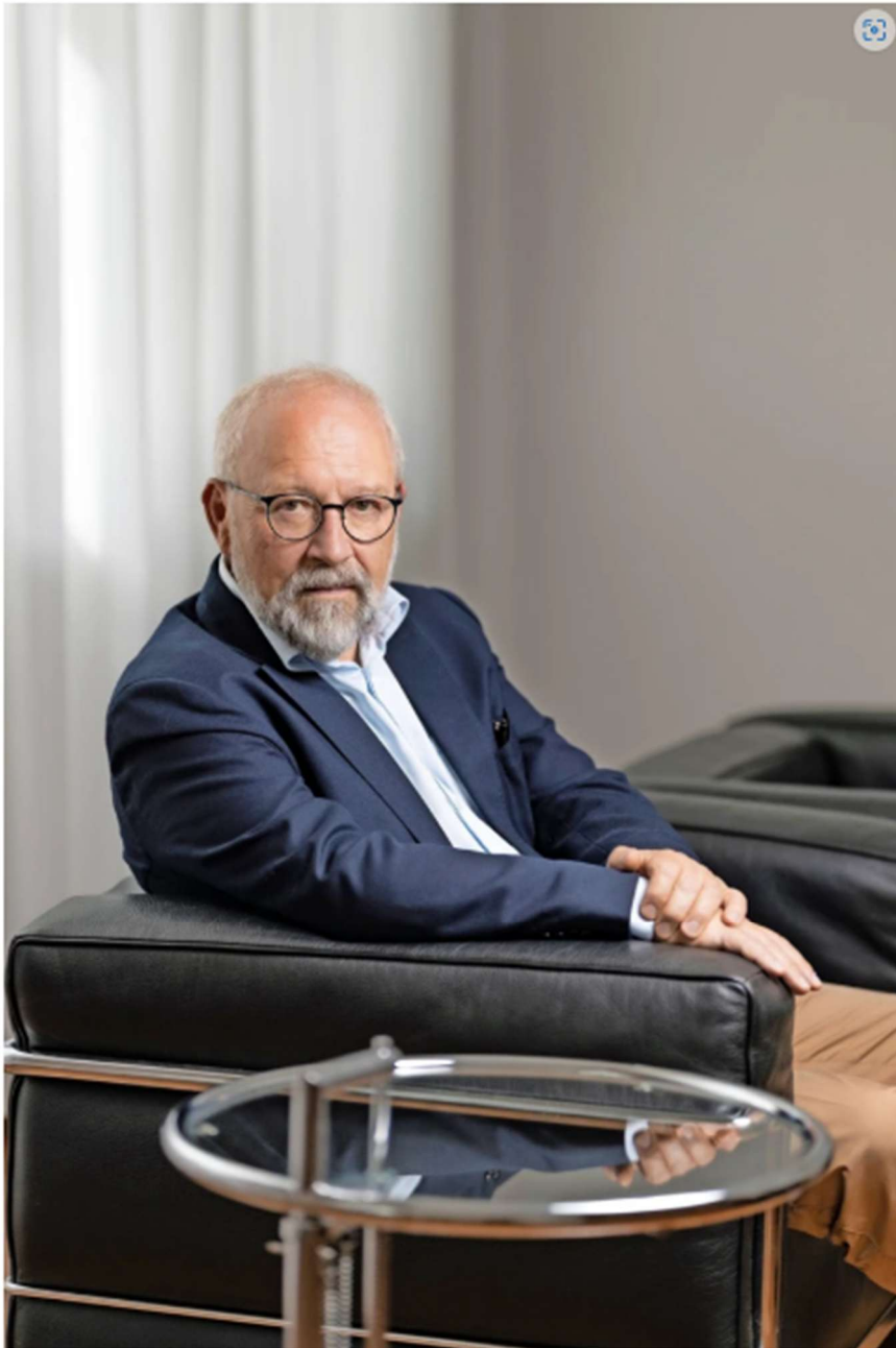
Herfried Münkler, im Hauptstadtbüro der Frankfurter Allgemeinen