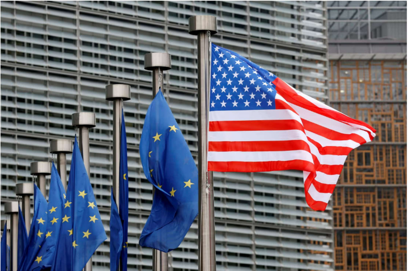
U.S. and European Union flags fly at the European Commission's headquarters in Brussels, Feb. 20, 2017.

Trump's re-election has exposed aesthetic and substantive divisions within the alliance.