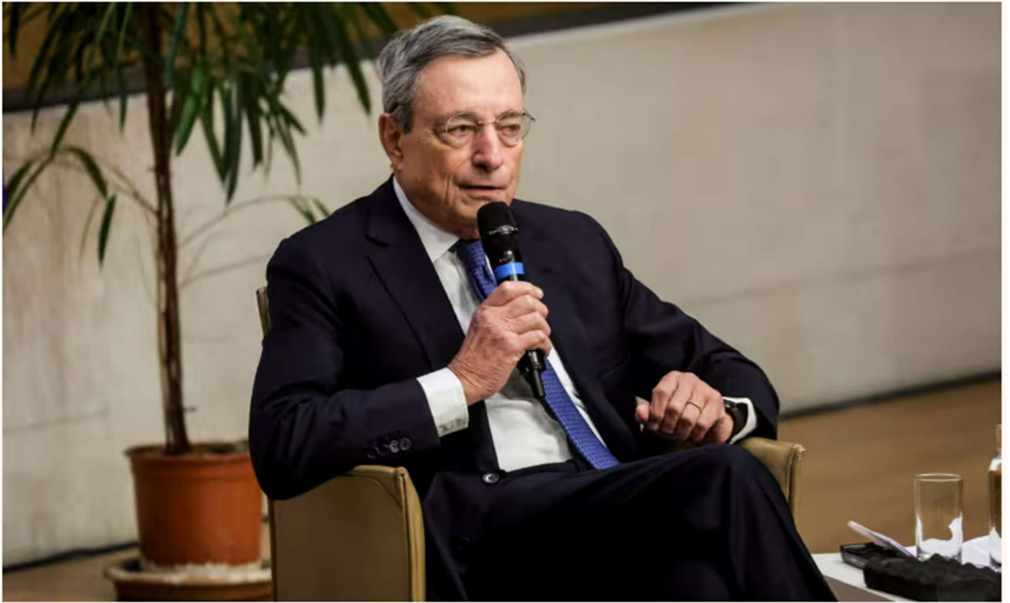
📷 Former European Central Bank president Mario Draghi attends a round table discussion on the the future of EU competitiveness at the College de France in Paris, on 13 November 13, 2024.

https://www.theguardian.com/commentisfree/2024/nov/16/trump-putin-xi-strongmen-are-at-the-gate-but-europes-leaders-are-too-busy-infighting-to-notice