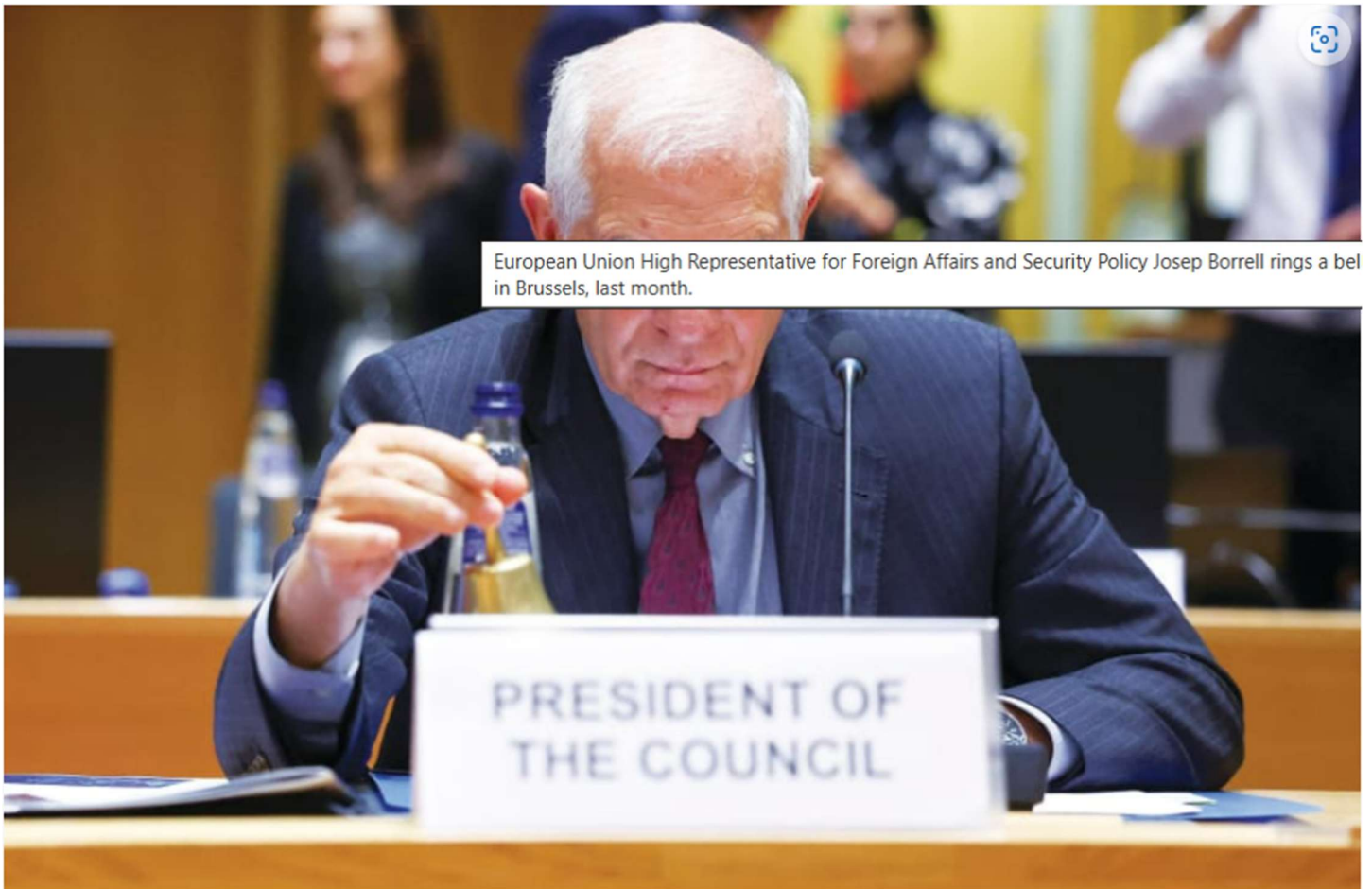
European Union High Representative for Foreign Affairs and Security Policy Josep Borrell rings a bell in Brussels, last month.

European Union High Representative for Foreign Affairs and Security Policy Josep Borrell rings a bell to start a meeting of EU defense ministers, in Brussels, last month.