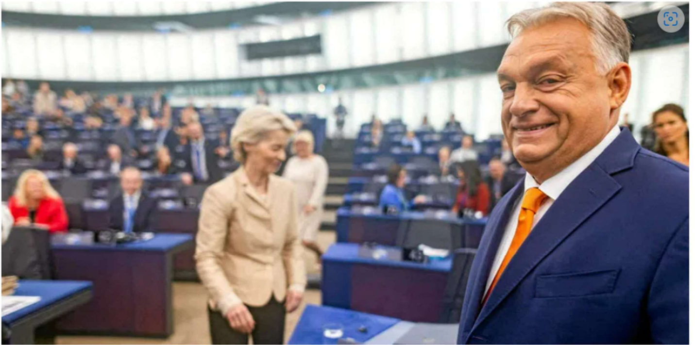
Ursula von der Leyen, présidente de la Commission européenne, et Viktor Orbán, le Premier ministre hongrois, le 9 octobre 2024 à Strasbourg (Bas-Rhin).