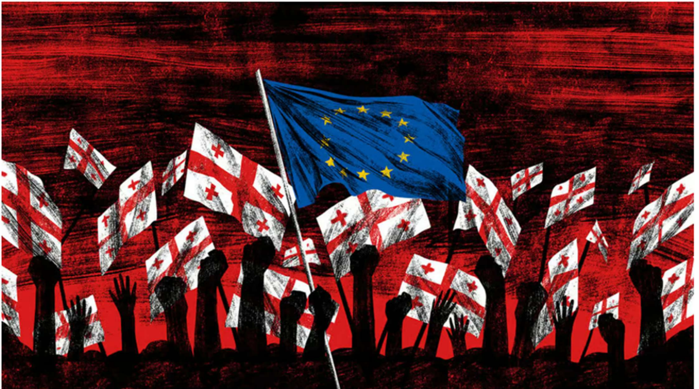
ILLUSTRATION: CHLOE CUSHMAN

Democratic activists in Russia's near-abroad pin their hopes on admission by the EU and NATO