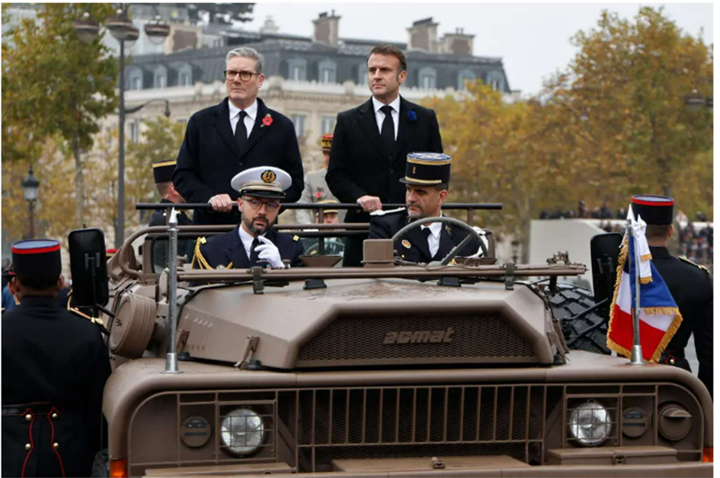
Prime Minister Keir Starmer of Britain joined President Emmanuel Macron of France in Paris last week to celebrate Armistice Day.