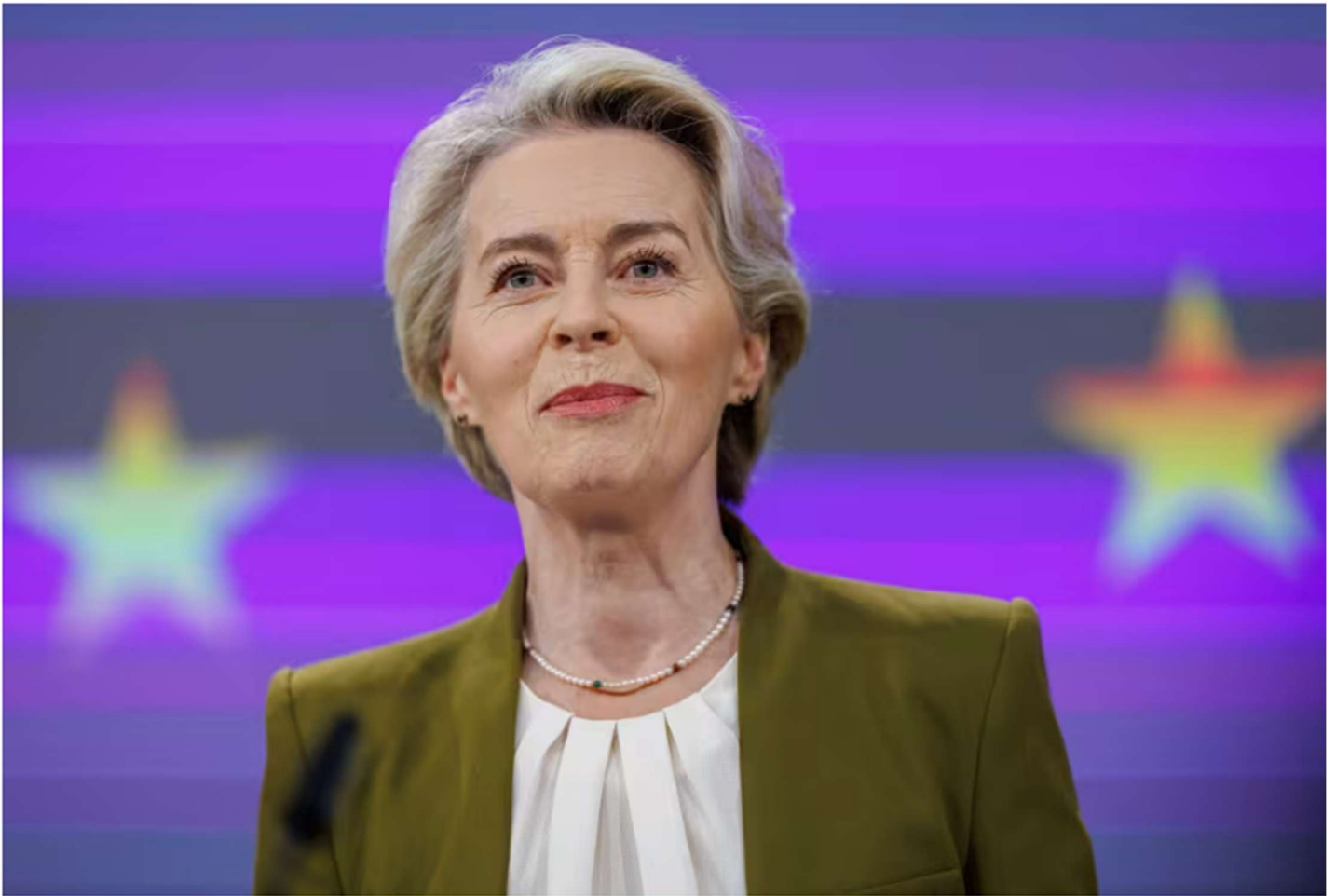
Ursula von der Leyen, president of the European Commission.