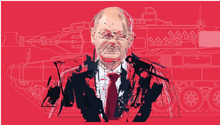
Illustration Simon Tanner / NZZ

Wer je geglaubt hat, in der internationalen Politik gehe es rational zu, sieht sich eines Besseren belehrt. Während sich die Ukrainer verzweifelt der russischen Übermacht entgegenstemmen, bot die Nato eine Vorstellung, die sich nur als Affentheater oder Kindergarten beschreiben lässt. Aus unerfindlichem Grund stilisierte die deutsche Regierung die Lieferung schwerer Kampfpanzer an die Ukraine zu einer neuen Eskalationsstufe im Krieg. Seine begehrten Leoparden wollte Berlin daher erst an Kiew abgeben, wenn auch Amerika den Abrams-Panzer zur Verfügung stellt. Das wiederum lehnte Washington ab.